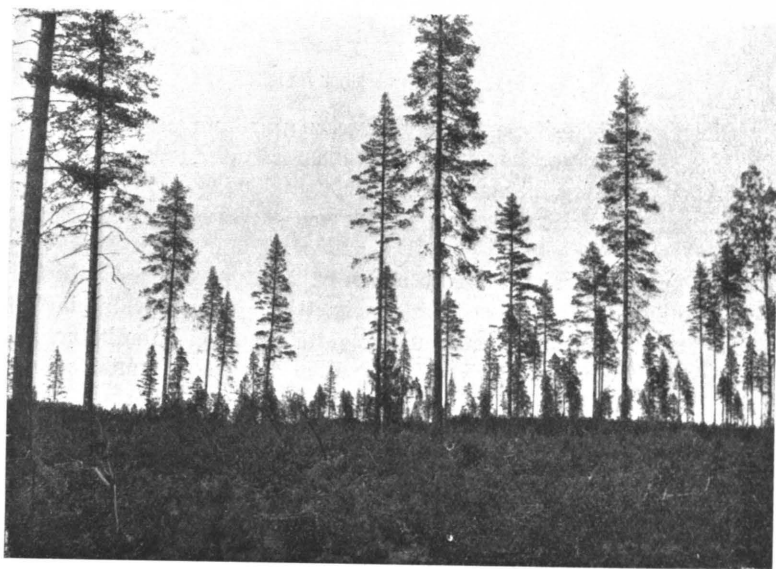
Kuva 1. Siemenpuuhakkausala Loimolan hoitoalueessa.

timuksia huomioon enemmän kuin aikaisemmin. Menekkiolojen entisestäään parannuttua on käynyt mahdolliseksi puhdistus- ja kasvatushakkaustenkin suorittaminen. Menekin puute syrjäisemmillä seuduilla asetti kuitenkin pinotavarahakkuille tietyt rajoituksensa. Mahdollisuuksien mukaan koetettiin kuitenkin myös puhdistushakkausia vanhoilla sahapuuhakkausjäljillä suorittaa, sillä taimistoja oli myös saatava nousemaan. Useasti jäi puhdistushakkausissa hakkausalue verraten huonoon tilaan, jota oli raivaustöillä sitten kunnostettava. Hakkausalalan raivauksilla olikin tähän aikaan vielä nykyistä suu-