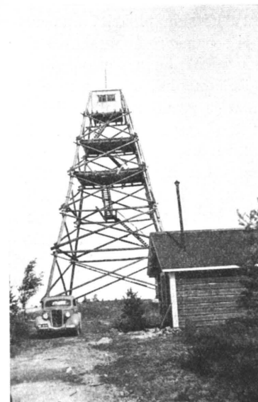
Kuva 7. Taamalan palotorni Äyräpään hoitoalueessa.

Edellä mainittua kehitystä eivät hoitoalueen henkilökunnan asunto-olot ole varojen puutteessa jaksaneet seurata. Itä-Suomen piirikunnassa on vielä huomattavassa määrässä virka- ja palvelusmiesten asuntoja, jotka eivät oikeastaan vastaa ihmisasunnolle asetettavia vaatimuksia. Tässä suhteessa olisi kipeästi aikaansaattava korjauksia.