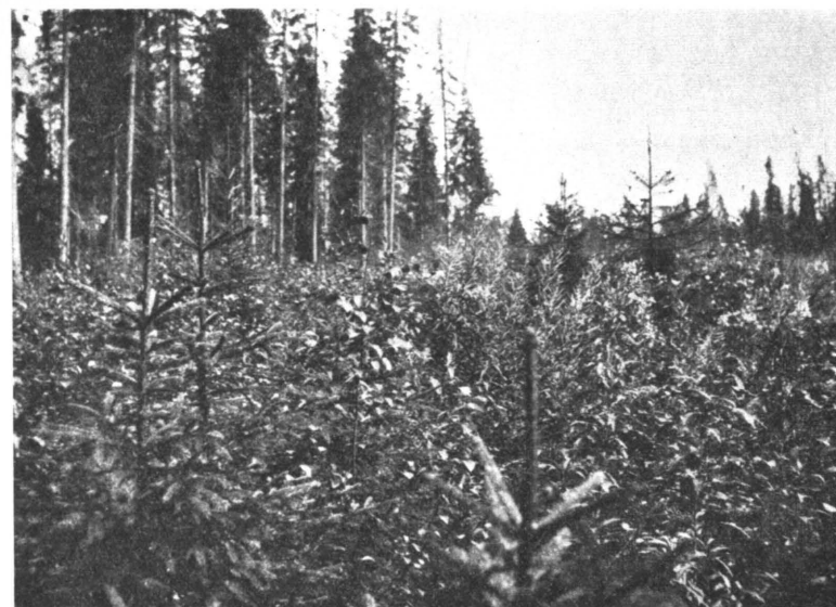
Kuva 2. Luonnon siemennyksestä nousutta taimistoa kasvullisella korpimaalla Loimolan hoitoalueessa.

Myyntitavoissa tapahtui myös v. 1923 muutosta. Siihen saakka olivat myynnit olleet miltei yksinomaan pystymyyntejä, jotka sovel-