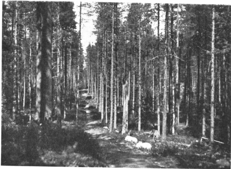
Kuva 3. Harvennettua keski-ikäistä mäntymetsää Loimolan hoitoalueessa polkupyörätien varressa.

muista syistä alettiin vähentää sahapuuhakkuita ja siirtyä puhdistushakkuita suorittamaan. Vaikeata oli aluksi näitä puhdistusleimikoita suuressa määrässä saada kaupaksi, mutta vähitellen ostajat tottuivat ja joinakin vuosina oli kysyntä melko hyvä. Kuitenkin syrjäisimmillä seuduilla varsinkin Pielisen ja Saimaan vesistöalueilla pientä mäntytavaraa sisältävien leimikoiden kaupaksi saanti oli vaikeata, useasti aivan mahdotonta, mistä syystä siellä on vasta viime vuosina Kaukopään sulfaattiseluloosatehtaan perustamisen jälkeen voitu hakkuita suuremmissa määrissä suorittaa. Myös kasvatushakkuita on