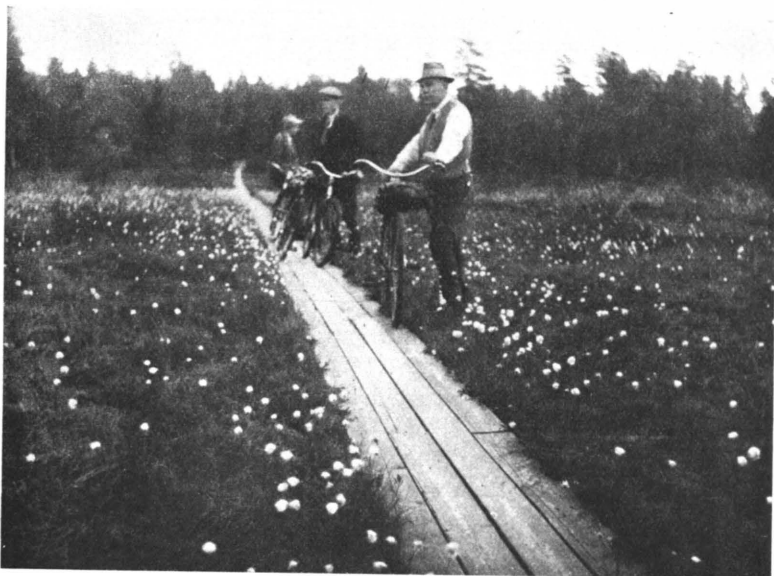
Kuva 6. Polkupyörätien porrastus niittyvillanevan poikki Loimolan hoitoalueessa.

Kulojen torjuntaan on kiinnitetty sen ansaitsemaa huomiota. Piirikunnassa oli aikaisempina vuosina kuloja melko paljon,