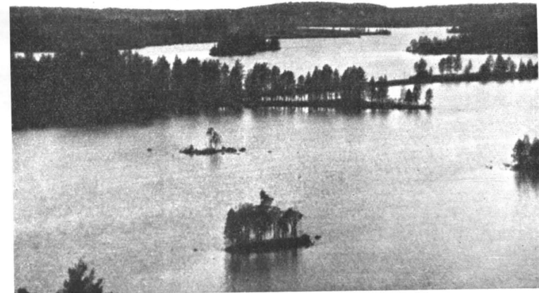
Kuva 9. Tolvajärven harjumaisemaa.

Karjalan rajaseudut, valtion maat, ovat karuja maita. Siellä ei ole monin paikoin maanviljelykselle suuria mahdollisuuksia. Ja missä