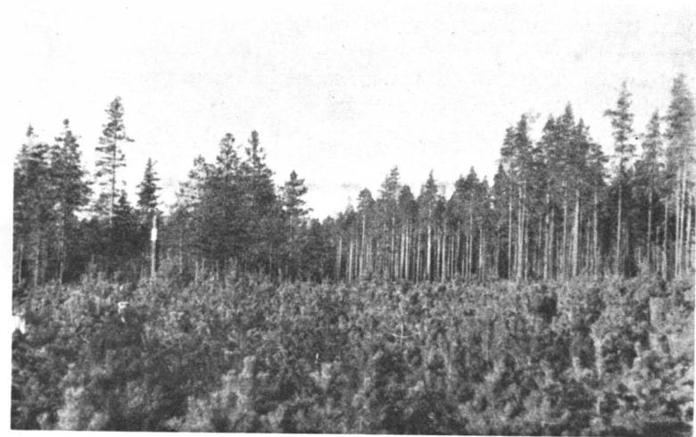
Kuva 4. V. 1928 suoritetusta kylvöstä noussutta männyn taimistoa Äyräpään hoitoalueessa.

Keinolliset metsänuudistustyöt ovat vuodesta 1923 lähtien ripeästi kasvaneet, varsinkin kylvötyöt. Kun näitä töitä v. 1923 oli vain 96 ha ja vuonna 1936 4,700 ha, niin on kasvu ollut noin 50-kertainen. Kyseellisenä aikana on kylvötyötä suoritettu yhteensä 38,029 ha:n ja