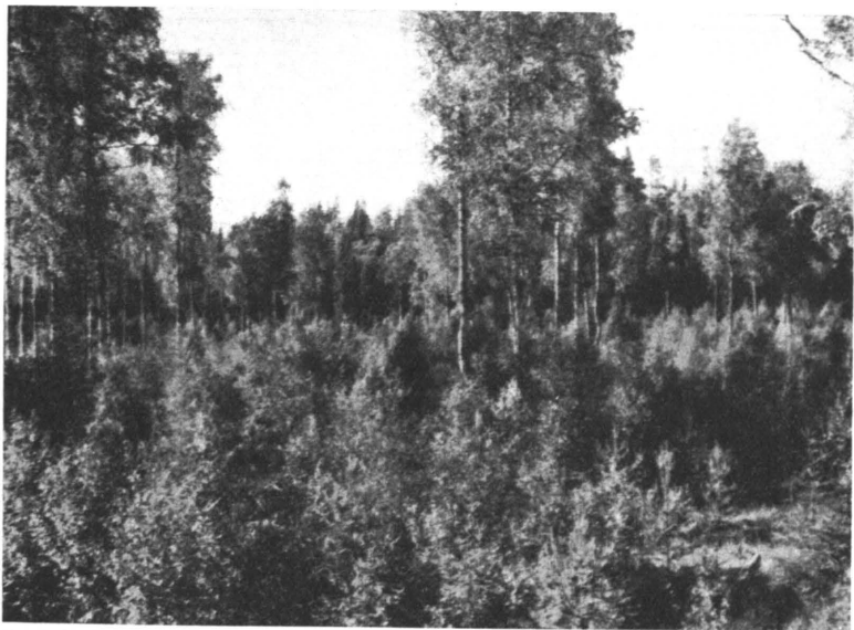
Kuva 7. Ojitettu ruoho- ja heinäkorp. Hyvää koivn-mänty-kuusitaimistoa sekä joi-takin koivuylispuita. Kivijärven hoitoalue. — Valok. 1937 A. Bockström.

Vuosina 1903—1937 on Länsi-Suomen piirikunnan alueella kaivettu uutta ojaa tai puroa 8,846,145 jn. Kuivatettu ala on tilaston mukaan 65,154 ha, joten kuivatettua suohehtaaria kohti tulisi 135 jn. Nykyisin lasketaan koko maassa tarvittavan keskimäärin n. 160 jn ojaa suoalan hehtaaria kohti, koska vanhemmat harvat kaivuut eivät kuitaneet riittävästi ilmoitettua alaa. Näin laskien supistuisi edellämainittu tilastossa oleva Länsi-Suomen kuivatettu suoala kuivatustehok-