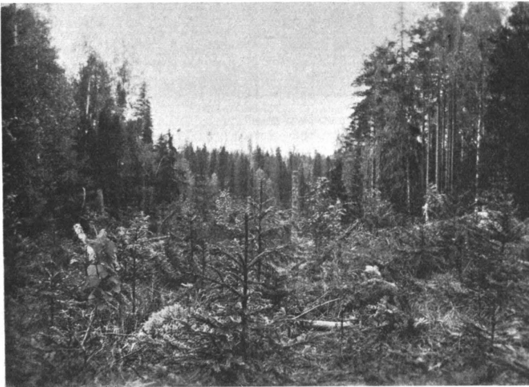
Kuva 6. Kaistalehakkaus. Viitasaaren hoitoalue.

Laajoissa yli-ikäisissä korpimetsissä on kaistalehakkaus johtanut edullisiin tuloksiin. Muodostamalla kaistaleet riittävän kapeiksi on kaistalehakkausta toisinaan käytetty eteläpuoliskon hyvillä kuusimailakin.