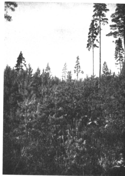
Kuva 4. Luontaisesti muodostunut kaunis männyn taimisto. Aureen hoitoalue.

kauksen luonteen. Milloin hakkausaloihin sisältyi reheviäkin maita, saattoi olla seurauksena, että metsän uudistuminen ruohottumisen vuoksi oli vaikeata ja vaati kalliita istutustöitä. Karuilla mailla ja siis varsinkin piirikunnan pohjoispuoliskossa on luonnollisesti lohkokakkuilla jatkuvasti ratkaiseva merkitys, varsinkin kun otetaan huomioon pohjoispuoliskon yli-ikäisten metsien runsaus. Viimeksi mainittujakin uudistettaessa on yleensä käytetty siemen- ja suojuspuuasentoa. Karujen