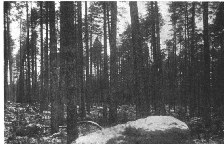
Kuva 3. Keski-Suomessa on vielä jonkin verran kilpikaarnaisia 200 + -vuotisia männiköitä, joiden loppuunhakkaamista sikäläisten keski-ikäisten metsien niukkuuden ym. vuoksi ei ole erikoisesti kiirehditty. Saarijärven hoitoalue.