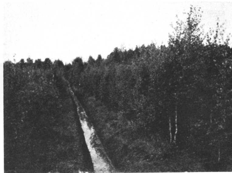
Kuva 8. Kylvöstä nousutta koivun taimistoa saranevalla. Kuivatettu 1921. Keski-Hämeen hoitoalue. — Valok. 1938 A. Bockström.

kuuden suhteen noin 55,000 ha:ksi. Vanhemmista ojituksista on siirtynyt metsätieteelliselle tutkimuslaitokselle noin 300,000 jn, samoin on osa joutunut asutusmaan piiriin. Länsi-Suomen piirikunnan alueelle on näin ollen jäänyt kuivatetusta suoalasta nykyisin noin 50,000 ha. Piirikunnan nykyisestä vesiperäisten maiden alasta (= 205,000 ha) on ojituskelpoiseksi arvioitu 60 %.