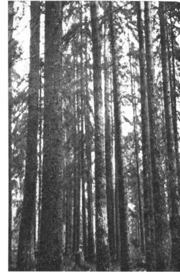
Kuva 2. Länsi-Suomen piirikunnan todennäköisesti puisevin metsikkö: OMT, 150 v., 580 m 3 hehtaarilla. Saarijärven hoitoalue, Pyhähäkin nk. luonnonpuisto. Valok. 1938 V. Lihtonen.

Mitä ikäluokkajaoitukseen eri puulajien muodostamissa metsissä tulee, on huomattavaa eroavaisuutta olemassa. Mäntyvaltaisista metsistä on 100 + -vuotisia 23 %, kun taas tämän ikäisiä kuusivaltaisia metsiä on suhteellisen paljon eli 37 %. Ikäluokkien 1—40 v. kokonaisalasta on mäntyvaltaisia 65 %, kuusivaltaisia 15 % ja koivuvaltaisia 20 %. Kuusivaltaisia taimistoja on siis niukasti, vaikkakaan yhdistelmästä ei käy