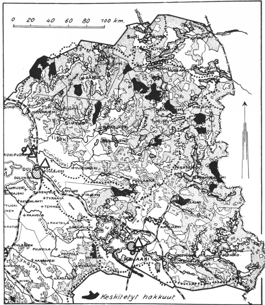
Kuva 2. Pohjanmaan piirikunnan keskityt hakkuut.

tetuiksi, eikä uusia talouskirjoja ollut lähiaikoina odotettavissa, koska arvioimismetsänhoitajat olivat sijoitettuina muihin kiireellisiin ammatti-tehtäviin. Kiertokirjeessä viitattiin niihin näkökohtiin, joita edellä on kosketeltu ja korostettiin erityisesti kuljetusolojen kehittämistä jatkuvien hakkuutöiden turvaamiseksi syrjäisillä metsäseuduilla ja uudistushakkausten laajentamista runsaiden puuvarojen irrottamiseksi.