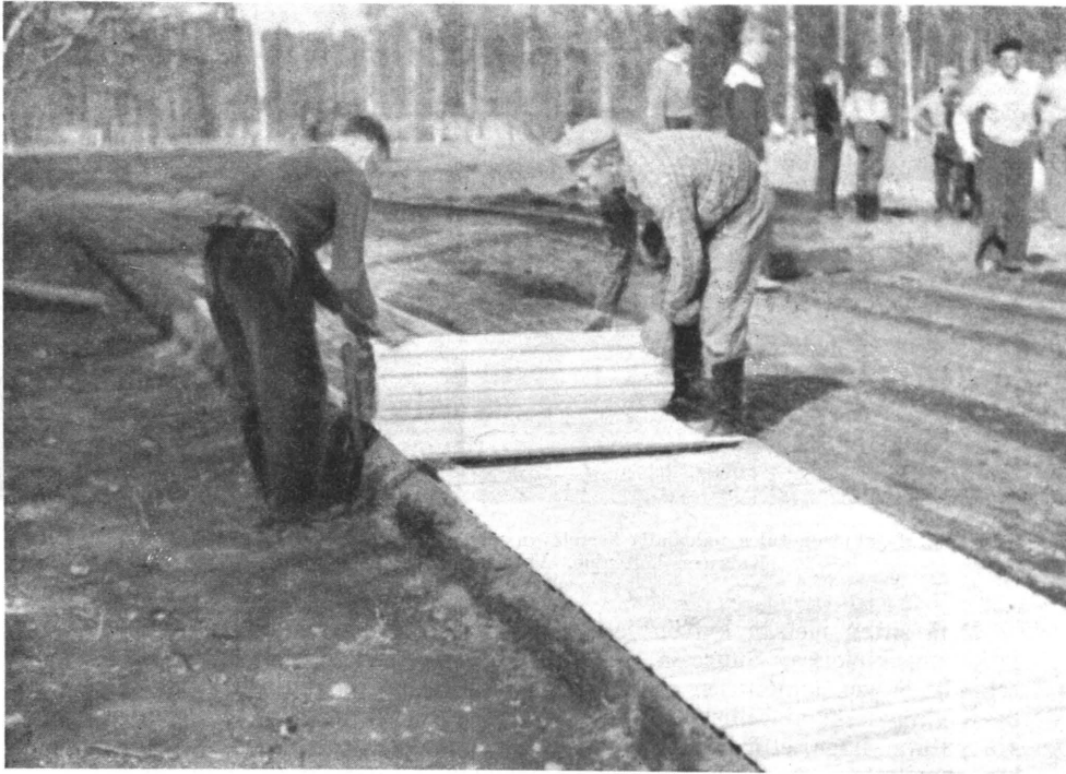
Kuva 6. Taimitarhakylvöksen ja eräiden arkojen taimien suojuksina ovat käytännöllisimmät rullakäihmetit rimoille levitettyinä.

täydentäminen sekä suojele monissa tapauksissa edelleen laiminlyödään. Tosin luonto täydentee usein runsaskätisestikin, mutta esim. lehtikuusi-, visakoivu-, tervaleppä- ja haapataimistojen täydennystyö sekä pelastaminen vesakon, ruohon, hangen ym. alle sortumisesta olisi hoitoalueissa ehdottomasti otettava jonkinlaiseksi omantunnon asiaksi, kunniatehtäväksi, joka osoittaisi metsänhoitajiston metsärakkauden, ei vain nyt, vaan tulevillekin sukupolville. Olisi kai tilanteen parantamiseksi eduksi, jos „käpy- ja metsänviljelyherra” eräissä hoitoalueissa määrättäisiin joko avustavasta metsänhoitajasta tai sitten metsätaloudesta piiriinsä. Edellisen menettelytavanhan sallii metsähallinnosta 3. 6. 1921 annetun asetuksen 46 § sellaisena kuin se on muutettuna 21. 4. 1939 (as. n:o 119/39). Asetuksen mukaan metsähallitus voi tarvittaessa uskoa joitakin aluemetsänhoitajille kuuluvia tehtäviä tai määrätyn osan hoitoaluetta avustavan metsänhoitajan hoidettavaksi tämän vastuulla.