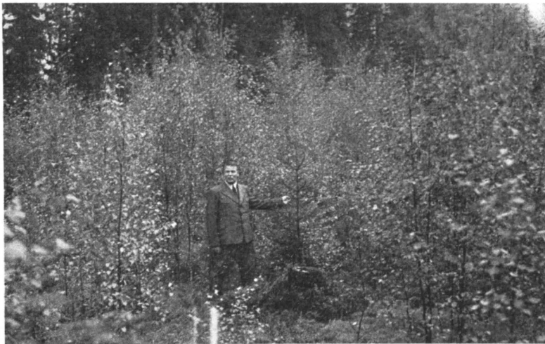
Kuva 2. Avohakkaus liukuvin reunoin kangaskorvessa. Koivua tullut verhopuuksi tavottomasti laiduntamattomalle metsämaalle. Tiheä kuusitaimisto alla nousemassa. Viitasaaren hoitoalue. Hakkauksesta kulunut 11 vuotta. Valokuv. E. Mork.

elintärkeiden toiminnanhaarojen tieltä. Rauhan teon jälkeen oli vaikeata saada valtion metsiin tarkoitettua määrärahaa nousemaan. Tästä vaikeudesta lienevät metsähallituksen kollegi, sekä eräät kansanedustajatkin vieläkin tietoisia. Rahanarvon muuttuessa valtion metsien hoitoon käytettävissä olevan määrärahan suhteellinen arvo on kieltämättä alentunut ja on esim. vuodelle 1952 laskeen vain n. 50 sadannesta siitä, mitä se oli v. 1939. Toiselta puolen on kuitenkin myönnettävä, että hallituksessa, eduskunnassa, metsänhoitomiesten joukossa ja suuressa yleisössäkin on ilmennyt pyrkimystä oikeaan tilanearvosteluun.