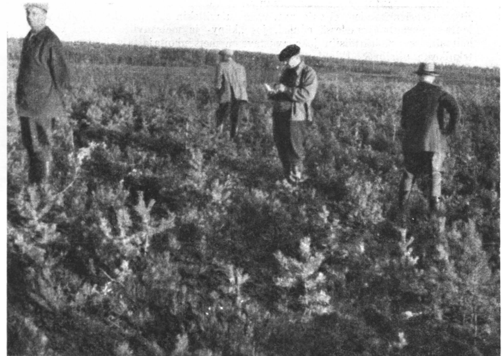
Kuva 5. Hajakylvön tulos paloaalalla äestettyyn maahan. 1 kg siementä on ehkä liikaakin. Kalajoen hoitoalue. Valokuv. V. K. Ahola.

voimassa, joten sen määräyksiä on noudatettava. Eräillä tahoilla levitetty tie-dot siitä, että peitatulla siemenellä on saatu huonompia tuloksia kuin peittaa-mattomalla, lienevät ennenaikaisia ja panee epäilemään, että tällöin on käytetty liian runsaasti peittäusainetta, joka on saattanut vaikuttaa negatiivisesti.