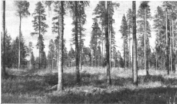
Kuva 1. Tiheä siemenpuuasento, lihavalla maalla. Hakkuualue raivattu. Kurun hoitoalue.

Esitettyä määräraha-asetelmaa tarkastettaessa ilmenee, että v. 1934 tapahtuneen ylimääräisen metsänhoidontarkastuksen jälkeen metsänhoitomääräraha huomattavasti kohosi, mutta sotien johdosta metsänhoito sai väistyä muiden