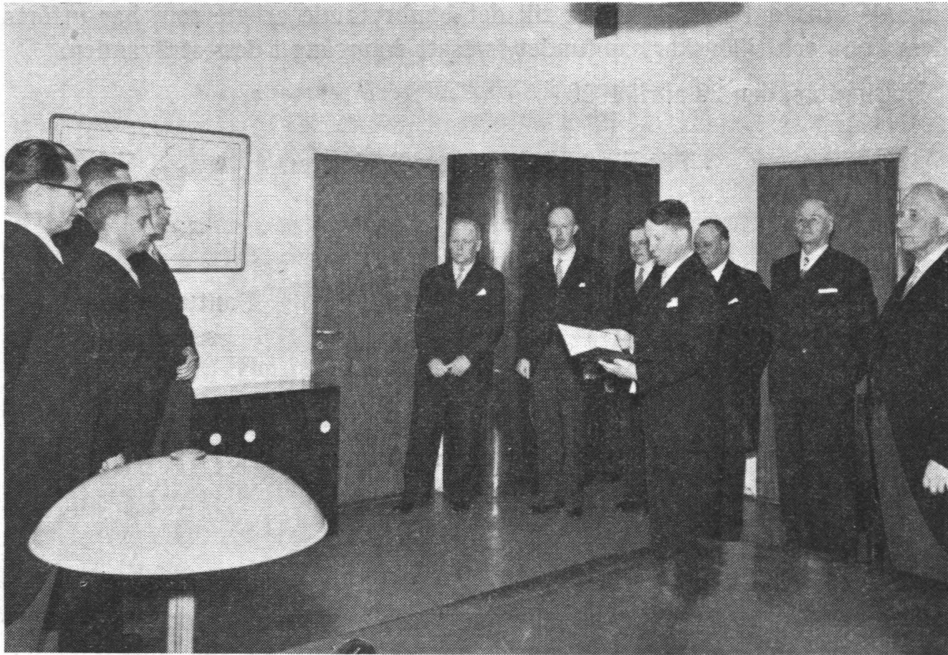
Metsäntutkimuslaitoksen hallitus onnittelee.