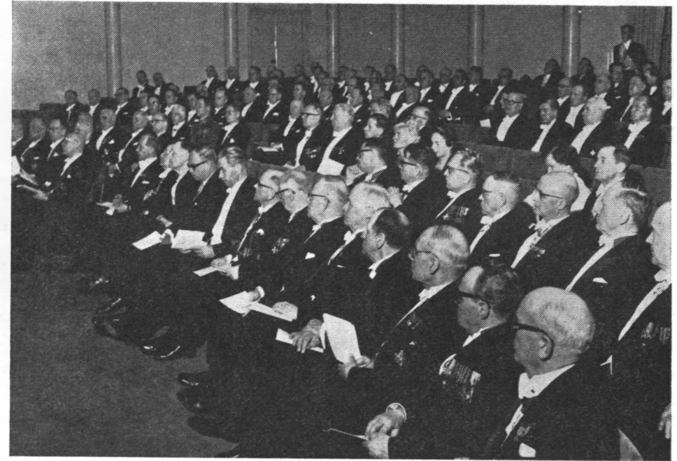
Juhlakokous Yliopiston pienessä juhlasalissa.

Metsätieteen katse on yleensä suuntautuneena eteenpäin, edessä oleviin tutkimustehtäviin ja ratkaisua odottaviin kysymyksiin. Mutta on paikallaan myös joskus hetkeksi pysähtyä silmäämään taaksepäin, kuljettuun matkaan ja sen varrella sattuneisiin tapahtumiin. Suomen Metsätieteellinen Seura on tänään, 50-vuotispäivänään, halunnut järjestää tämän juhlakokouksen erityisesti kunnioittaakseen niitä miehiä, jotka ovat suomalaiselle metsätieteelle uraa uurtaneet,