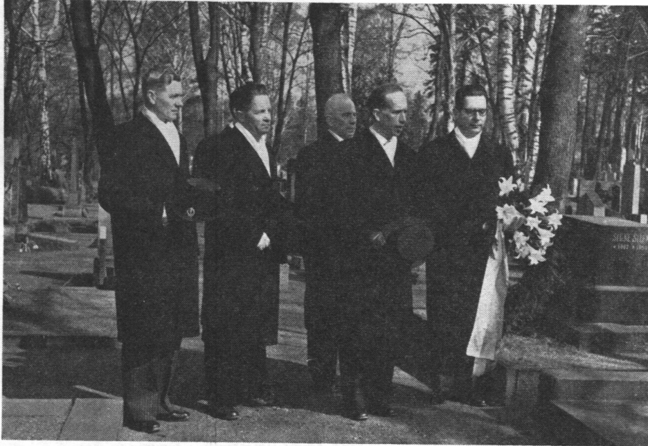
Juhlapäivän aamuna Seuran hallitus suoritti kunniakäynnin Seuran perustajan A. K. Cajanderin ja ensimmäisen puheenjohtajan P. W. Hannikaisen haudoilla.

sämme, on omiaan mitä suurimmassa määrin vahvistamaan suomalaisessa metsätiedemiehessä tervettä, omahyväisyydestä vapaata itseluottamusta.