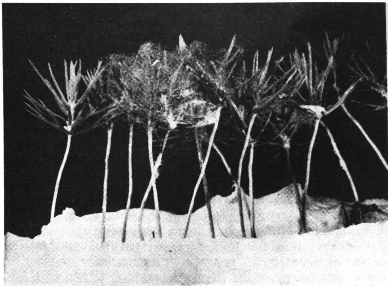
K u v a 1. Herpotrichia nigra n rihmaston kietomia 1-vuotisen kuusen taimia infektiokokeessa. P. Haataja.

yrkästi terveisiin taimiin. Pahemmissa tapauksissa ovat suuret alat taimista kauttaaltaan harmaanruskeita neulasten tuhoutumisen vuoksi. Lukuisissa keväisin keski- ja pohjois-Suomen taimistoista kerätyissä kuusen taiminäytteissä todettiin H. nigra vaurioiden aiheuttajana 1- ja 2-vuotisilla kuusen taimilla. Muutamissa harvoissa tapauksissa määritettiin sieni myös männyn taimista, mutta varsinaisena tuhojen aiheuttajana se ei näissä tapauksissa esiintynyt.