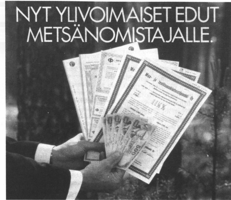
Kuva 4. Konfliktityyppinen mainos: arvopaperit ja rahat ovat työntyneet perinteisen metsänäkymän eteen.