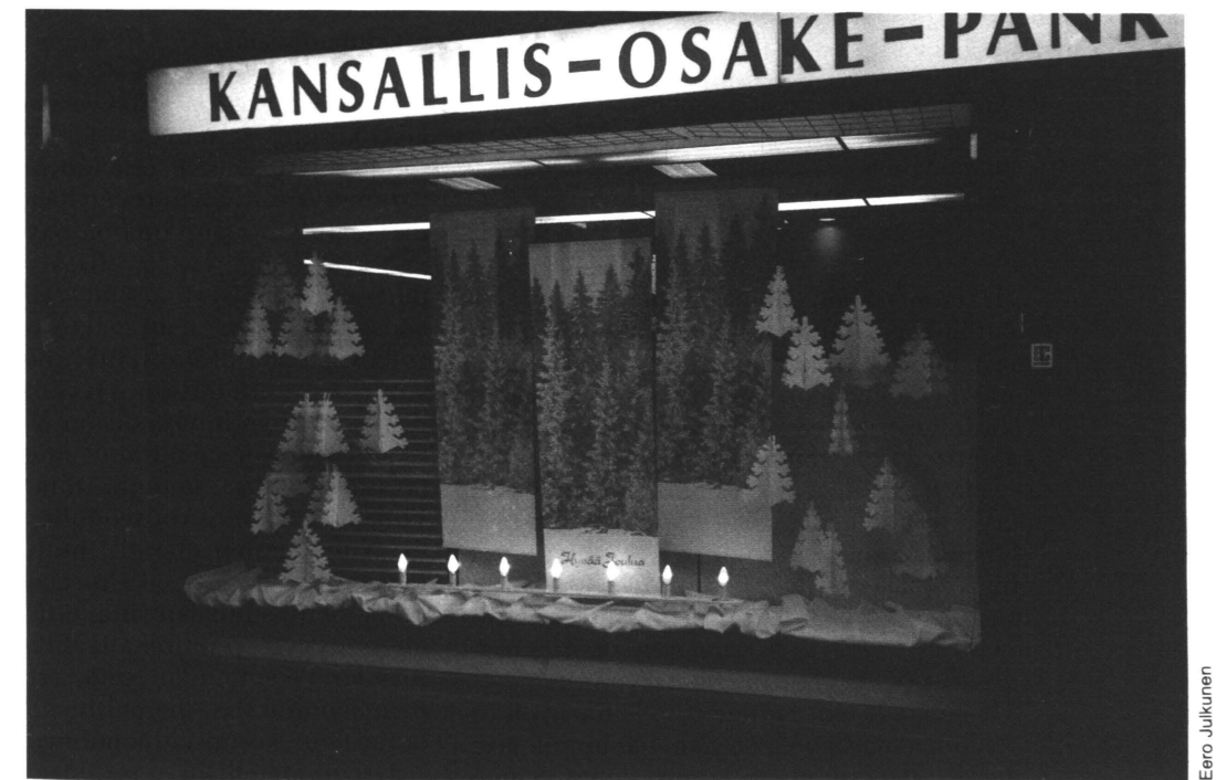
Kuva 1. Pankin ikkunasomistus jouluna 1986 Helsingissä. Fig. 1. Window decoration of a Helsinki bank at Christmas time in 1986.