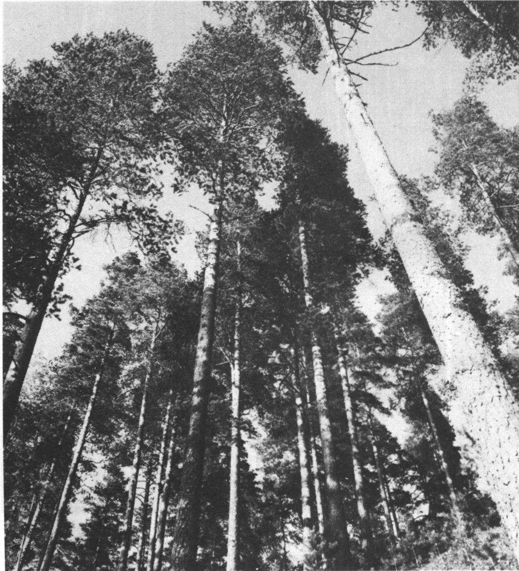
Kuva 3. Pankin mainoksessa kuva tyvestä latvaan korostaa arvokkaita tukkipuurunkoja, metsää raaka-ainelähteenä. Fig. 3. In a bank advertisement, an upward picture of trees emphasizes the value of saw timber trunks: the forest as a source of raw material.

Se, missä tarkoituksessa metsää mainostetaan, useissa tapauksissa määrää myös sen esittämisen näkökulman. Voimme muodostaa seuraavan kaavion: