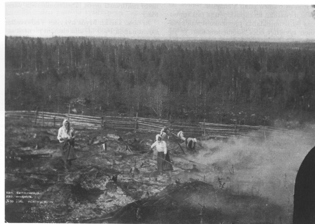
Kuva 2. Kaskenviertäjiä Enossa. I.K. Inhan valokuva vuodelta 1893. Fig. 2. Slash-and-burn cultivation. A photo from eastern Finland in 1893.

Kaskiviljelytalous oli mahdollistanut maamme suurimmaksi asutusliikkeeksi nimi-