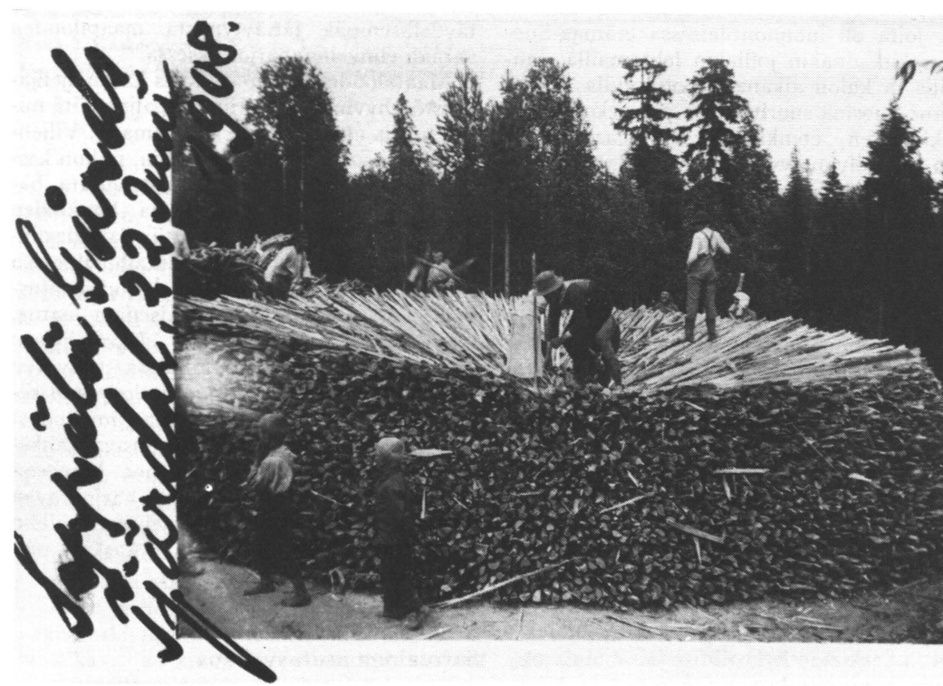
Kuva 1. Tervahautaa rakennetaan Seppälän kartanossa 1908. Fig. 1. Pine-wood being piled for tar burning in Seppälä Manor in 1908.

1600-luvulla myyntiä varten harjoitettu tervanpolto oli merkittävää suuressa osassa Järvi-Suomea Saimaan ja Päijänteen vesistöalueilla, Uudellamaalla ja osassa Varsinais-Suomeakin sekä koko Pohjanmaan rannikoseudulla, Etelä-Pohjanmaalla myös kauempana sisämaassa. Satakunta vuotta myöhemmin terva-alue käsitti etelässä enää pieniä aloja Saimaan lounaispuolella, Etelä-Hämeessä ja Varsinais-Suomen takamaissa mutta siihen kuuluivat laajat alat Pohjanmaata eteläiseltä Suomenselältä Oulujärvelle ja Simoon asti; rannikolle terva-alue ulottui enää Iin – Simon seudulla. 1800-luvun mit-