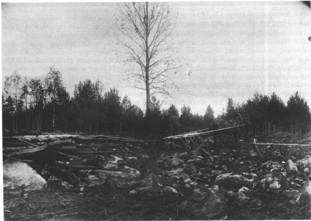
Kuva 3. Kaskiruis kylvettiin palaneeseen maahan ja jyvät peitettiin risukarhin avulla. Kuva Joroisista vuodelta 1894. Fig. 3. Rye grains were sown in the black soil and covered using a horse-drawn hoe. A photograph from Joroinen in 1894.

Kaskeaminen oli vielä 1800-luvun alkupuolella lähes kaikkialla maassa tunnettu ja ainakin jonkin verran käytetty viljelymuoto. Täysin tuntematon se oli vain suppeilla alueilla läntisessä rannikko-Suomessa ja Keski- ja Pohjois-Lapissa. Kaskiviljelyn painopiste on ollut kuitenkin Itä-Suomessa: itäisessä Keski-Suomessa, Savossa ja Karjalassa, missä kaskeamista harjoitettiin monin paikoin tälle vuosisadalle asti. Tuoreimmat tiedot kaskenpoltosta ovat Savosta ja Pohjois-Karjalasta 1940-luvun lopulta, vieläpä 1950-luvulta. Tällöin kaskeaminen oli kuitenkin lähes aina yhteydessä laidunmaan tai uuden pellon raivaukseen. Heinämaaksi tai pelloksi raivattavalta metsäalalta otettiin ensin sato kaskiviljelymenetelmän mukaisesti ja sitten ala muokattiin pysyväksi pelloksi tai heinämaaksi.