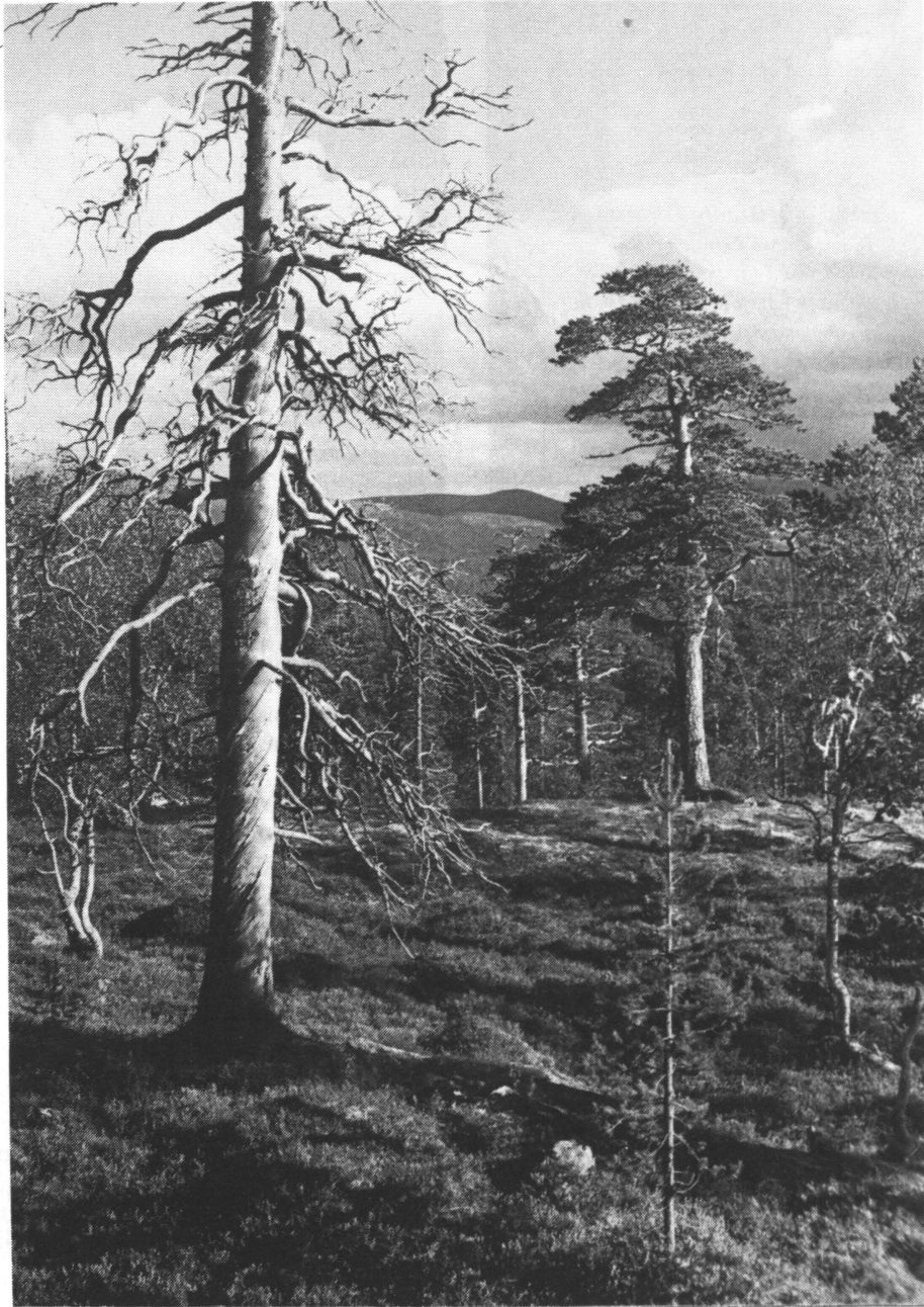
Kuva 2. "Sinun kuivat mäntykäsivartesi". Helvi Hämäläinen koki metsän turvallisena emona. Fig. 2. "Your dry pine-arms". Poet Helvi Hämäläinen has written about the forest as a protecting female.

Lempo seisoi suon selällä, Hiidet hirnui kankahalla, juuttahat jälestä juoksi, maasta Maahinen kohosi. (Leino 1977, 75)